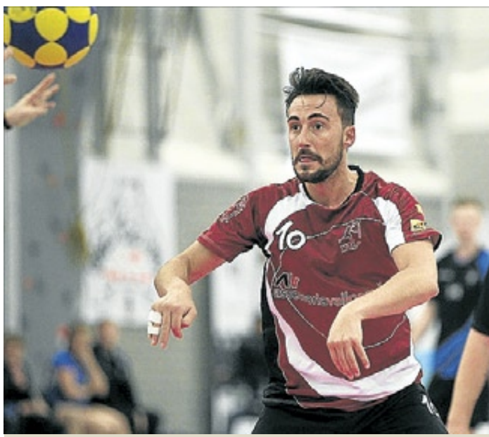
L'equip terrassenc ha perdut 23 a 24