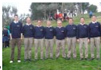
Gualta Point P