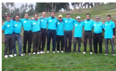
Badalona Motorsol Import