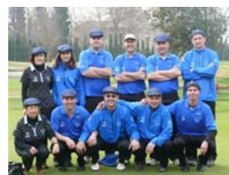
Backswing Blanes Muralla Optica