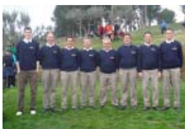
Gualta Point P