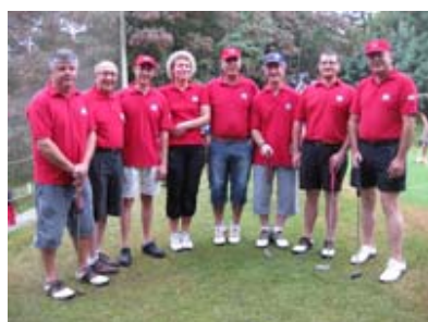
Sant Cebrià Vermell