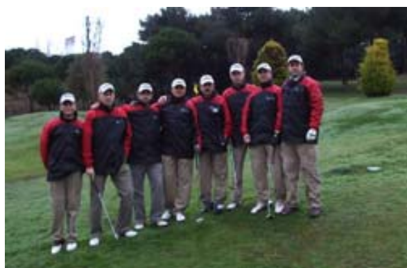
La Garriga A