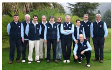
Sant Cebrià Blau