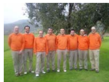
6Q i + Anòia