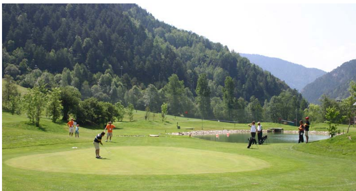
Imatge d'arxiu d'Ordino