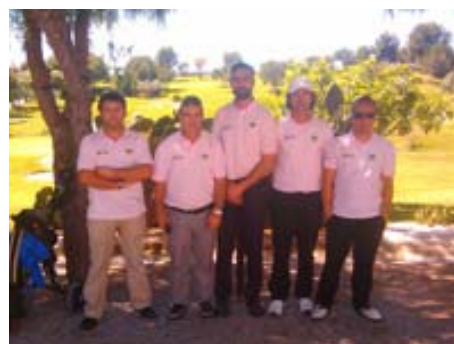
Freak and Draw