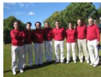
P&P Barcelona Teià