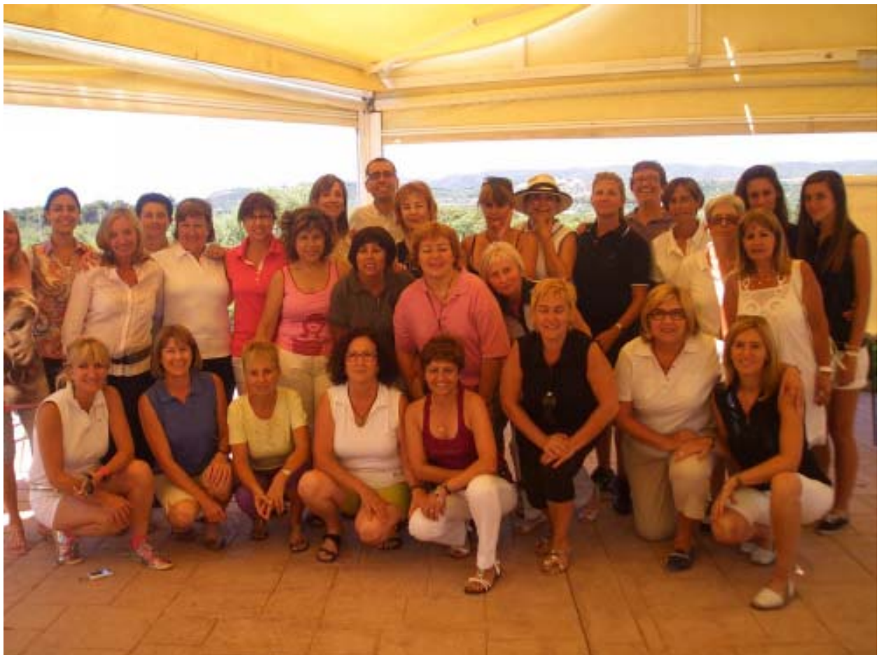
Participants al II Clinic al Vendrell. Al' anterior pàgina participants al II Clinic de Franciac

Bases per donar el meu màxim al camp del forat 1 al 18.