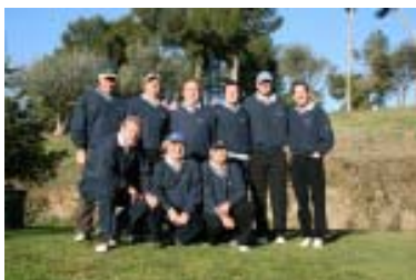
CG Natació Montjuïc