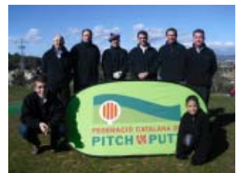
Sant Cugat P&P