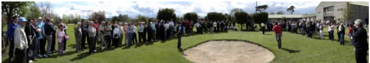
Irish Open 2010...the 18th Green at R.G.S.C.