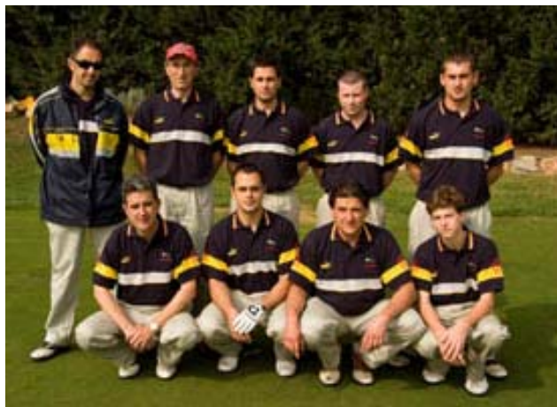
La Selecció que va guanyar en el 2008 la Challenge Cup

La Challenge Cup, competició internacional de pitch & putt que havien de jugar les seleccions d'Irlanda i Catalunya a Dublín el 22 d'abril es va suspendre per la impossibilitat per part dels integrants de la selecció catalana d'arribar a Irlanda. El tancament de l'espai aeri, a causa del núvol provocat per les cendres de l'erupció del volcà d'Islàndia, va fer cancel·lar el vol previst Girona-Dublín del 20 d'abril i va ser impossible trobar una forma alternativa d'arribar a la illa maragda. La Pitch & Putt Unión of Ireland i la Federació Catalana de Pitch & Putt estan estudiant noves dates per a poder jugar la competició en el 2011. Es preveu que sigui el 14 o 15 d'abril però encara no són dates definitives.