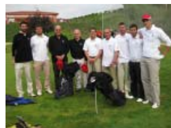
P&P Par 2008