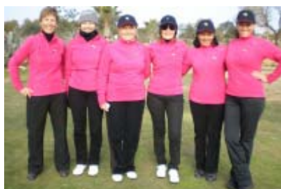
Portal del Roc