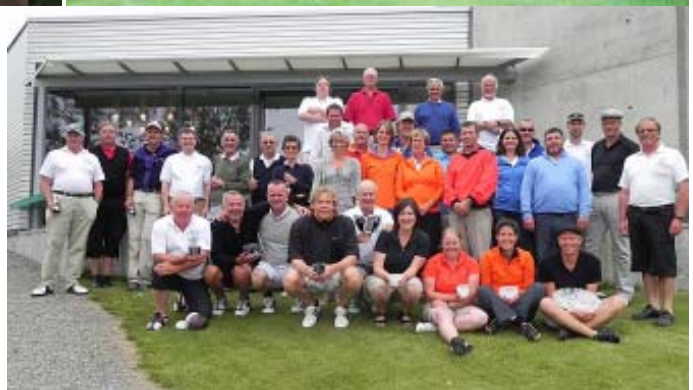
Open de Noruega