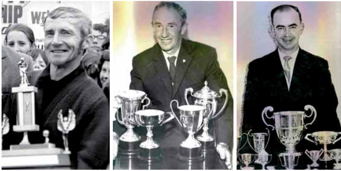
Guanyadors de diferents Campionats Nacionals irlandesos a la dècada dels seixanta i principis del setanta.