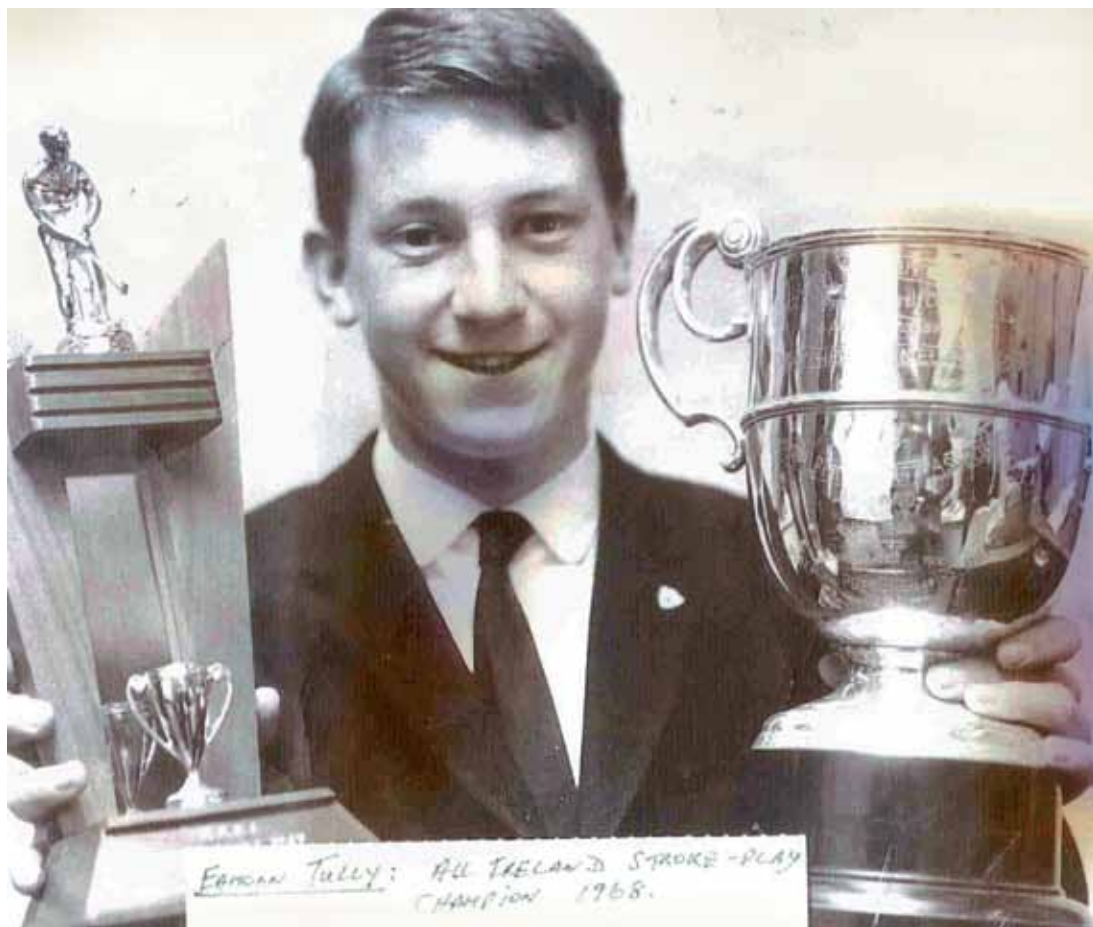
Guanyadors de diferents Campionats Nacionals irlandesos a la dècada dels seixanta i principis del setanta.