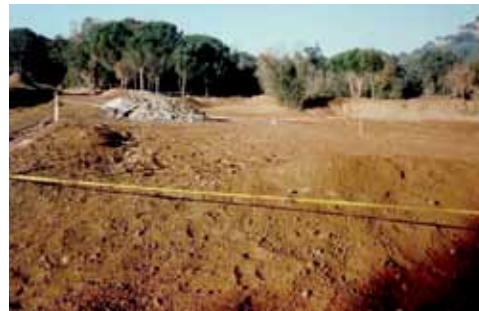
fotos: 1.- Imatge del moment de plantar el magnífic conjunt d'arbres que presidien la part dreta del carrer del 18 i del 17. 2.- Felicitació nadalenca. 3.- Imatge de les banderes del 15 (en primer pla) i del 17 al fons. Més al fons, la masia de Can Dalmau. 4.- Imatge del que seria el green del 18 envoltat amb cordes. A la dreta podem veure el projecte del llac i els pins que hi havia al voltant del green del 12. Al fons a l'esquerra es pot apreciar el tee de 15, elevat entre pins.