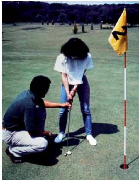
Fotos: 1.- Imatge de la petita casa club, que ja era pràcticament acabada. Els únics arbres que hi havia a la zona eren plataners alts i prims. Més tard s'hi plantarien acàcies i un petit jardinet que envoltava una petita terrassa. 2.- Imatge del cartell publicitari que es va instal·lar a peu de la carretera de Llagostera a Santa Cristina. 3.- Perspectiva de la zona on s'ubicaria el green de putts, tot el carrer del 18, i els futurs greens del 18, 12, 14 i 15, tapats amb plàstics negres. 4.- Imatge de l'equip irlandès durant el primer gran enfrontament internacional a Solius l'any 1997. 5.- Magnífic detall de la riquesa natural que servia de marc al forat 2 i a la façana de Can Dalmau. 6.- Imatge de com el professor de Solius, Pedro, imparteix classes.