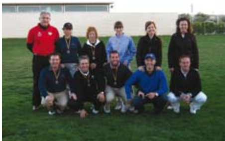
Copa ACPP de Parelles Mixtes 2010