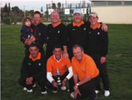
HCP1, equip guanyador de la Copa Catalunya 2010