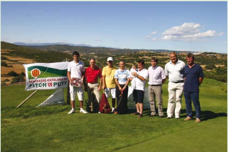
Campionat de Catalunya Absolut 2010

Gaudiu del 2011, gaudiu del millor Pitch & Putt.